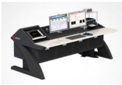
电机试验台典型案例

前端数字化_复杂电磁环境下的高精度测量解决方案 不同功率因数下相位误差对功率测量准确度的影响 幅值对测量准确度的影响？ 准平均值真的可以替代基波有效值吗？